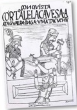
Exécution d'Atahualpa, dernier empereur Inca, sous les ordres du conquistador espagnol Francisco Pizarro en 1533.

« Alors que les Indiens étaient si bien disposés à leur égard, les chrétiens espagnols ont envahi ces pays tels des loups enragés. Voici les causes pour lesquelles, dès le commencement, furent tuées tant de personnes. En premier lieu, tous ceux qui sont venus ont cru que, s'agissant de peuples infidèles il leur était possible de les tuer, de leur prendre leurs terres, leurs biens et leurs domaines. En second lieu, ces soi-disant infidèles étaient les êtres les plus pacifiques du monde, totalement dépourvus d'armes. Et ceux qui sont venus étaient le rebut de l'Espagne, un ramassis de pillards ».