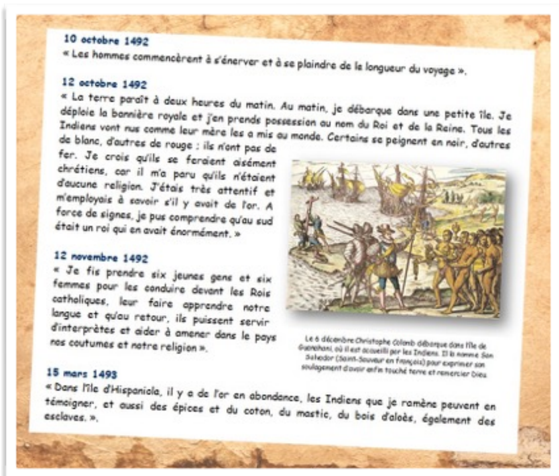
DOC 6 - Quelques étapes du voyage d'après le carnet de bord