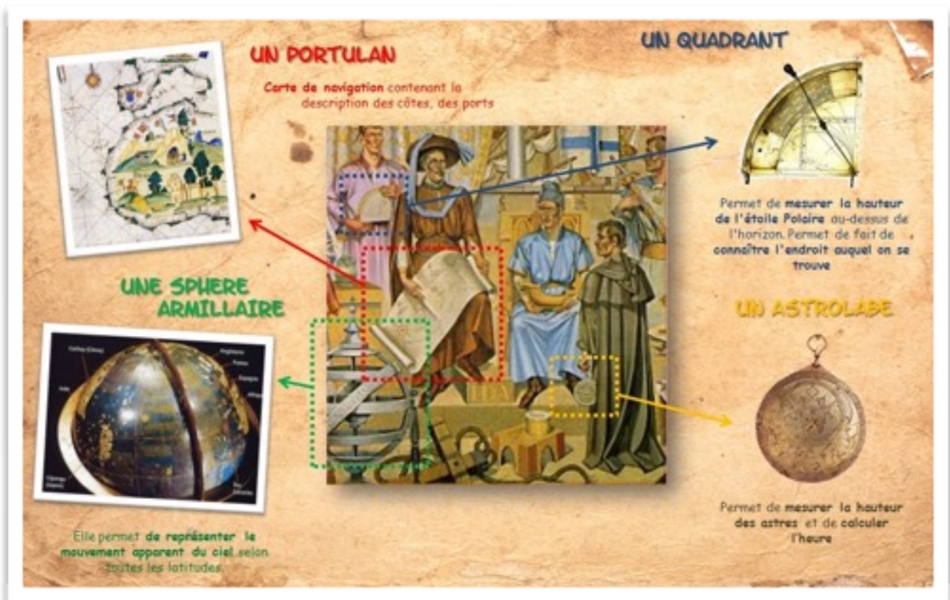
DOC 3 - Des outils nouveaux pour voyager