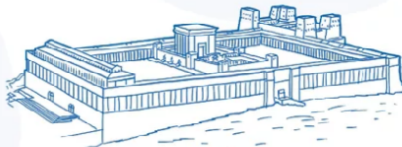
Culte au Temple de Jérusalem Puis dans des synagogues