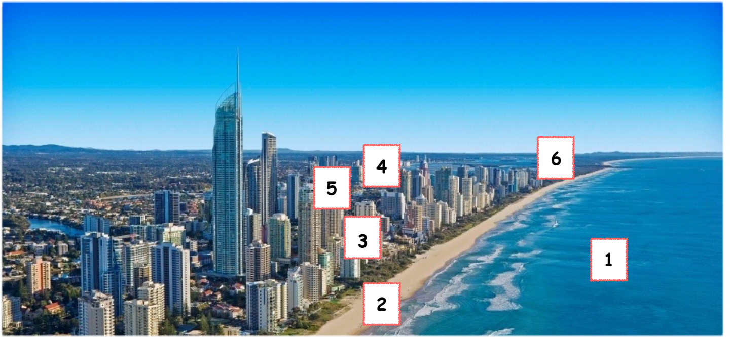
Doc. 1 : Vue aérienne de Surfer Paradise

1 - L'Océan Pacifique 2 - La plage de Surfer Paradise 3 - Les gratte-ciel sur le front de mer abritent des hotels, des bureaux, des magasins 4 - Paradise Waters, quartier résidentiel de luxe 5 - Adrenalin Park, le parc d'attraction de la station balnéaire 6 - Port de plaisance