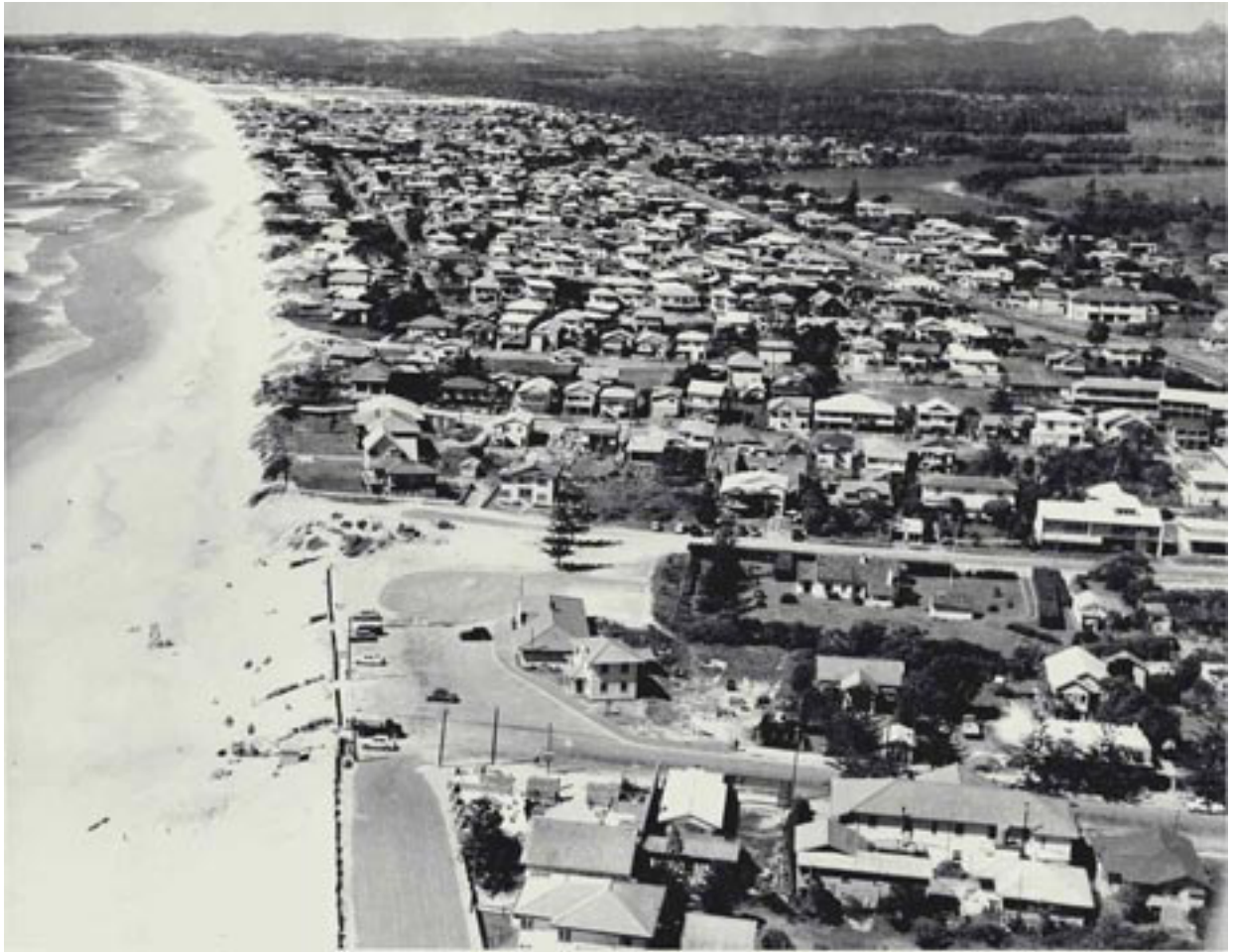
Doc. 6 : Une vue aérienne oblique de Surfer Paradise et de Broad Beach en 1955

Doc. 5 : Surfer Paradise - Gold Coast : le portail internet de la station balnéaire de Surfer Paradise: histoire, activités,