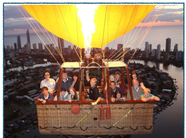
Doc. 4 : Quelques activités à réaliser en plein air à Surfer Paradise: cours de surf, stand up paddle, kayak, montgolfière