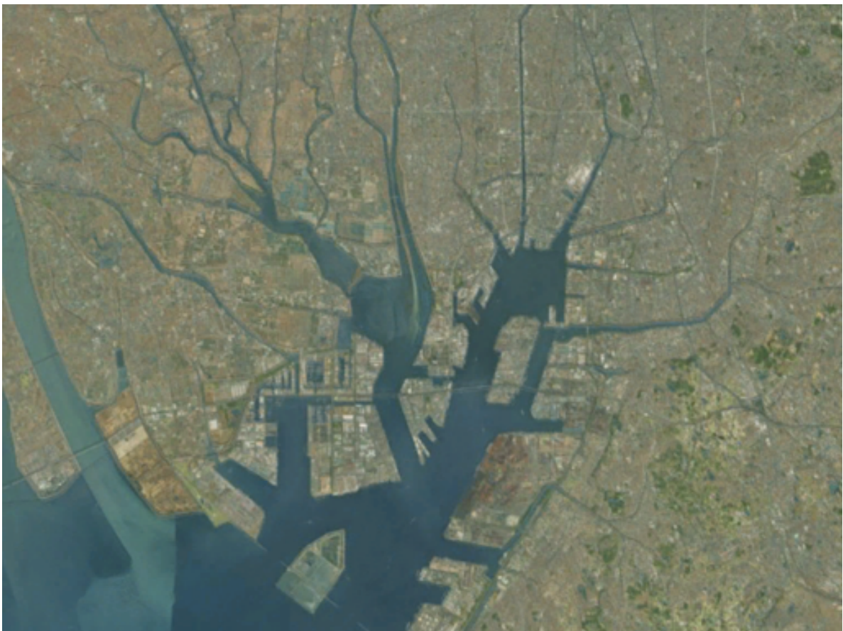
Doc. 3 : Vue satellite de la baie et du port de Nagoya