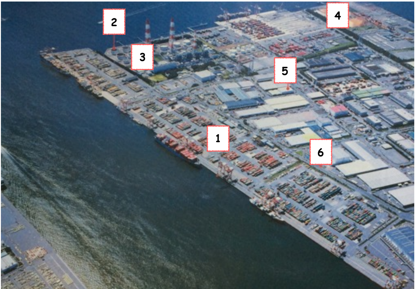
Doc. 1 : Un terre-plein de la baie de Nagoya, Tobishima Pier.

1 - Quai à conteneurs (grosses caisses en métal chargées de marchandises), 2 - quai avec des zones de stockage de pétrole 3 - usine électrique 4 - Quai minéralier (pour les minerais) 5 - Entrepôts 6 - Voies rapides