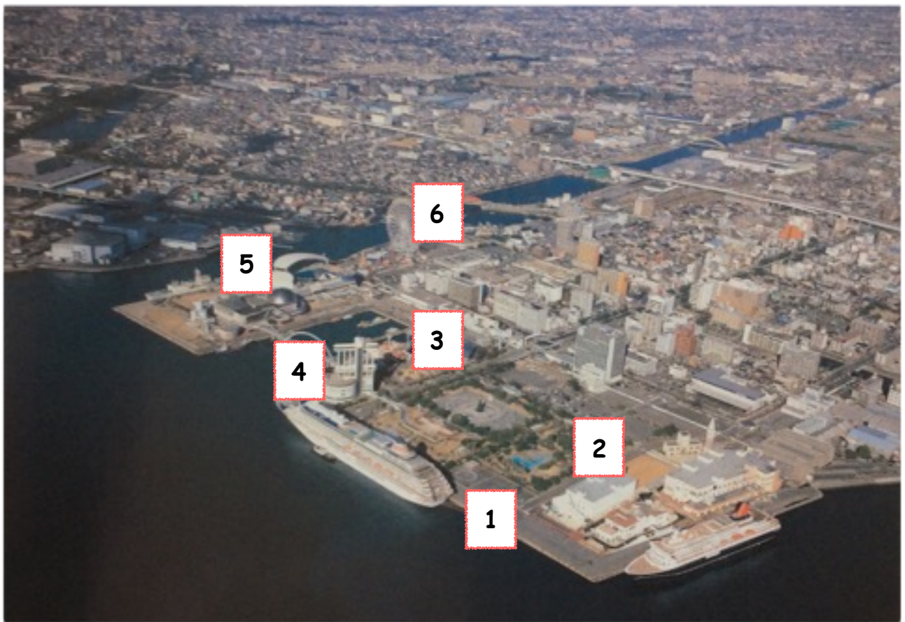
Doc. 4 : La reconquête du front de mer: Garden Pier