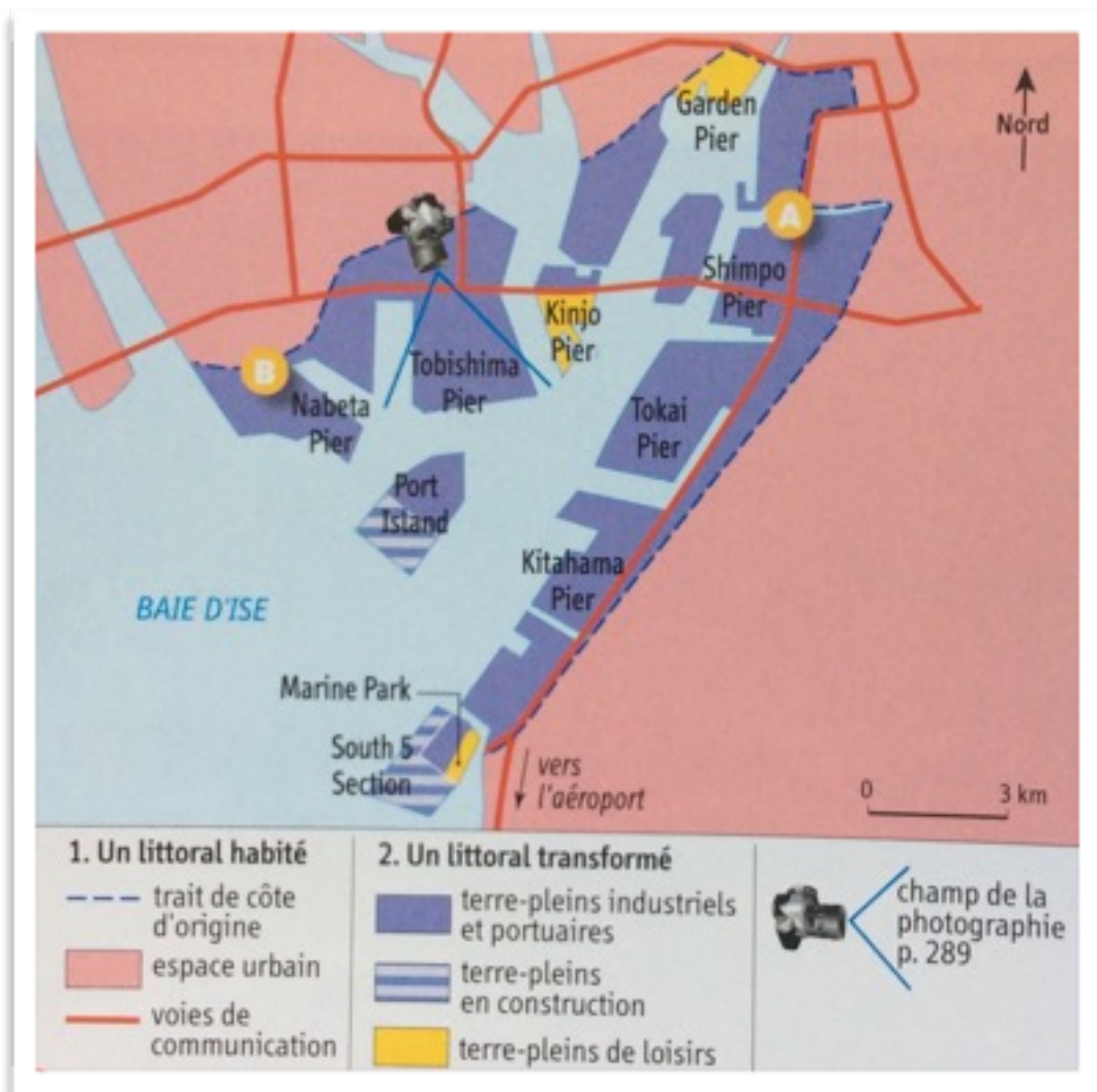
Doc. 5 : La baie de Nagoya.