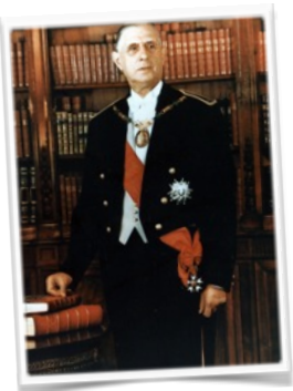
Les années de Gaulle 1959-1969