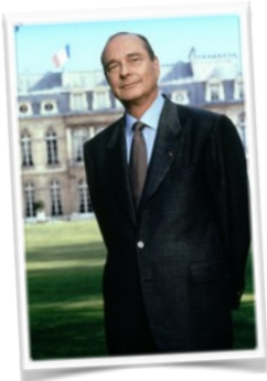
Les années Chirac 1995-2007